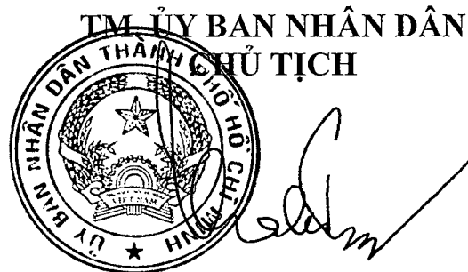
Nguyễn Thành Phong

2. Trong quá trình triển khai thực hiện Quy định này, nếu có vấn đề phát sinh hoặc vướng mắc, xét thấy cần thiết, kịp thời phản ánh về Ủy ban nhân dân thành phố (thông qua Sở Nội vụ) để sửa đổi, bổ sung cho phù hợp với yêu cầu thực tiễn và quy định pháp luật hiện hành./.