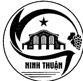
Hình 2. Mẫu in đen trắng