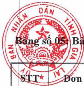
Bảng số 05: Bảng giá đất trồng cây hàng năm khác