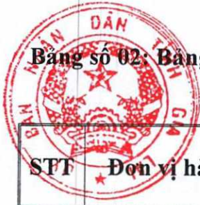
Bảng số 02: Bảng giá đất ở tại nông thôn