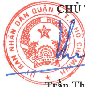
Trần Thế Thuận