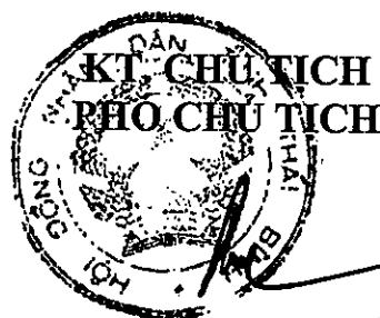
Đàm Văn Vượng

Trong quá trình triển khai thực hiện Quy định này, nếu có vướng mắc cần sửa đổi, bổ sung thì Ủy ban nhân dân tỉnh trình Hội đồng nhân dân tỉnh xem xét, sửa đổi, bổ sung cho phù hợp. / Đàm Văn Vượng