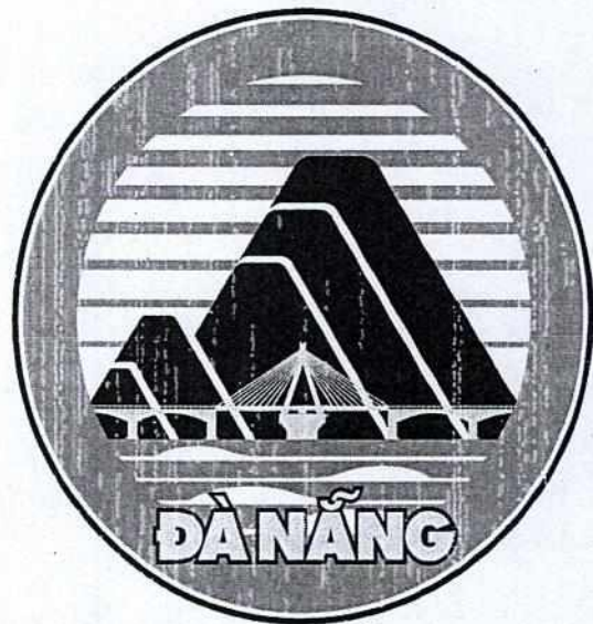
Hình 01. Mẫu Biểu tượng in màu