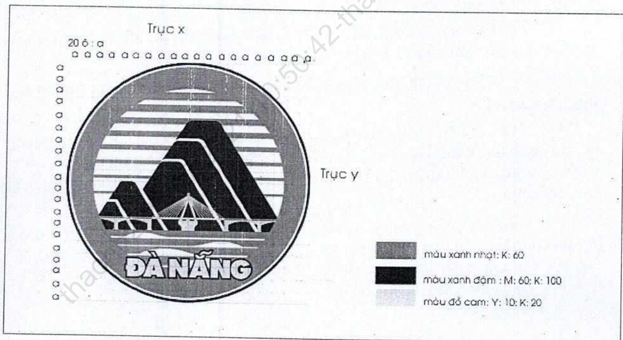
Hình 04. Mẫu Biểu tượng đen trắng trên lưới tỷ lệ chuẩn với các chỉ số màu cơ bản

b) Các chỉ số kỹ thuật của các màu sắc trên mẫu Biểu tượng màu: