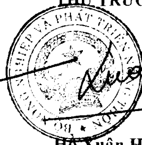
Hồ Xuân Hùng